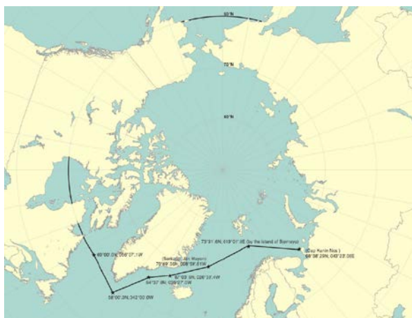
図 1-1: 極海コードの対象海域(北極海)