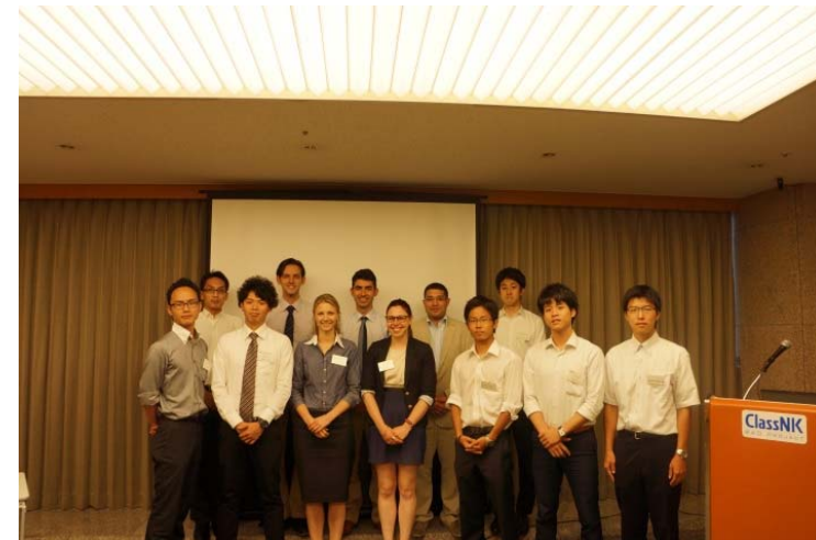
国内外の学生による研究交流 セミナー(2014年NK主催)