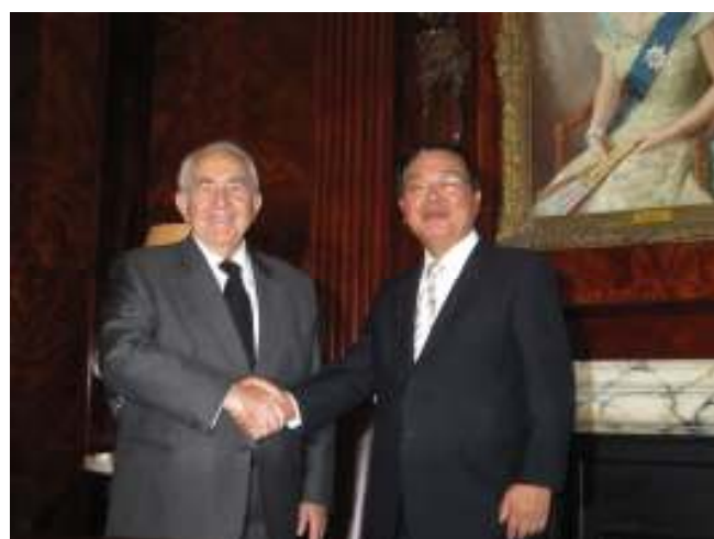
写真2 ICSのPolemis会長と上田会長