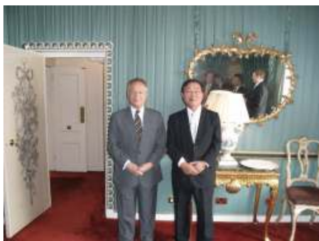
写真1 IMOのMitropolous事務局長と上田会長

一方、IACS は、業界要望に応えるべく現行の油タンカーとばら積貨物船のための2つのCSRを一本化する調和CSR開発プロジェクトを開始している。今般のIMO GBS