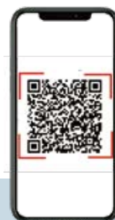
QRコードによる確認