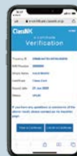
モバイル承認画面